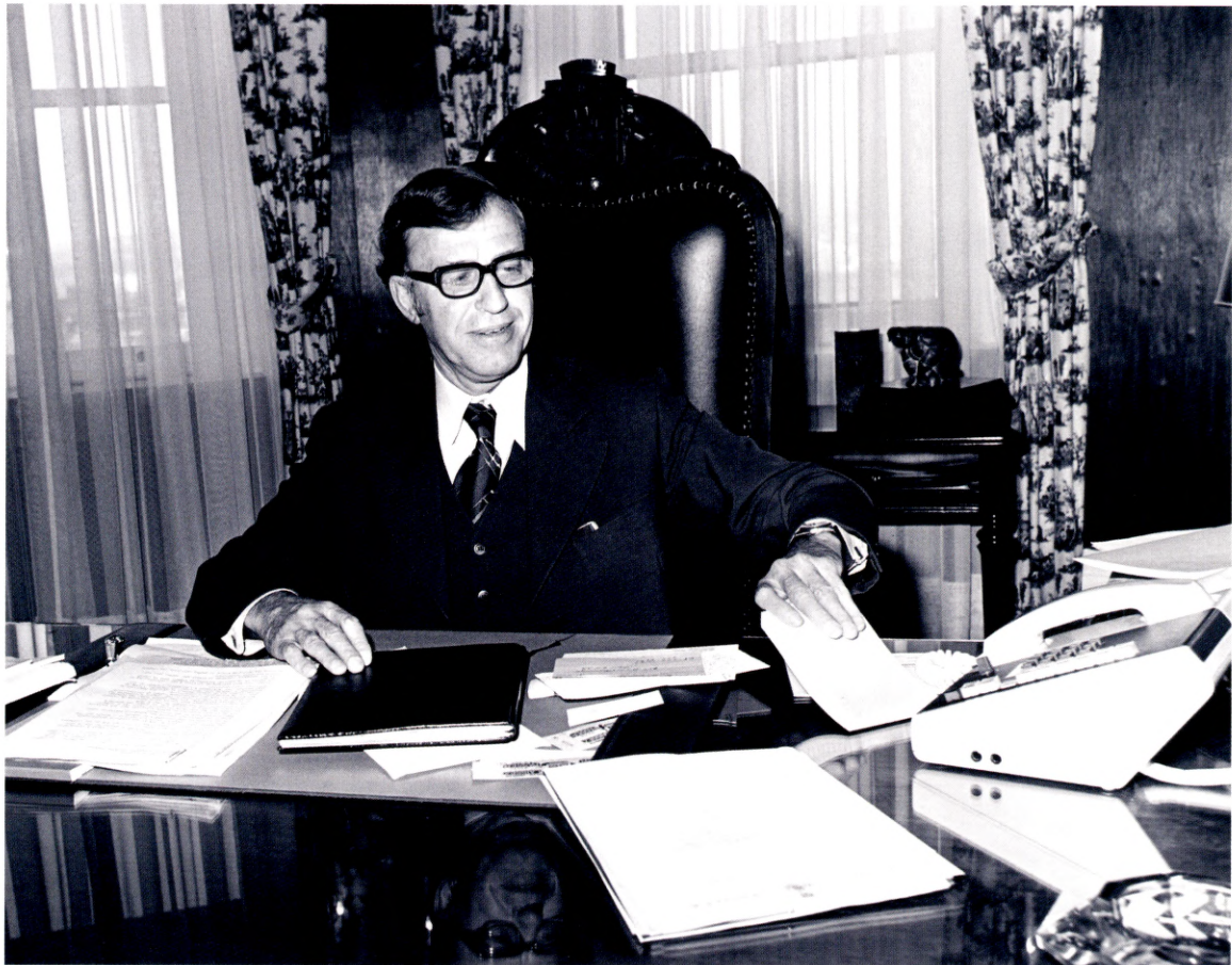
L'HONORABLE GILLES LAMONTAGNE À SON BUREAU DE LA MAIRIE DE QUÉBEC EN SEPTEMBRE 1977, QUELQUES SEMAINES SEULEMENT AVANT QU'IL NE FASSE LE SAUT EN POLITIQUE FÉDÉRALE.

de président de l'Union des municipalités du Québec (1974-1977), de vice-président de la Fédération canadienne des municipalités, de membre de la direction du Conseil de planification et de développement du Québec et de membre du Conseil économique du Canada.